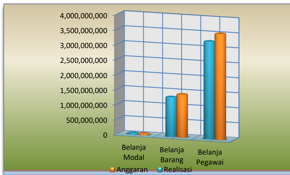
Grafik Komposisi Anggaran dan Realisasi Belanja Untuk periode yang berakhir 31 Desember 2020

Sedangkan realisasi anggaran belanja menurut output kegiatan, baik program Dukungan Manajemen dan Pelaksanaan Tugas Teknis Lainnya (DMPTTL) dan Penyediaan dan Pelayanan Informasi (PPIS) kegiatan tersaji dalam tabel dibawah ini.