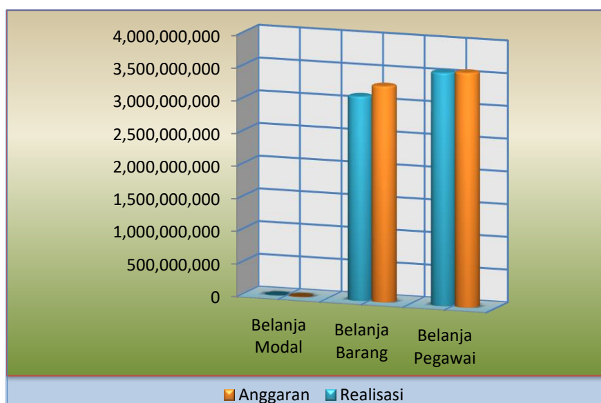
Grafik Komposisi Anggaran dan Realisasi Belanja Untuk periode yang berakhir 31 Desember 2022

Sedangkan untuk komposisi anggaran dan realisasi belanja dapat dilihat pada grafik di bawah ini: