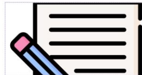
Lihat pengaduan/saran sebelumnya