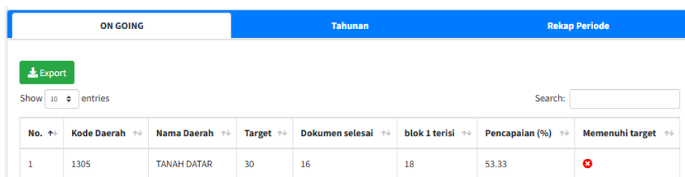
Gambar 8. Jumlah dan Persentase Responden Triwulan 1 BPS Kabupaten Tanah Datar

PST BPS Kabupaten Tanah Datar memiliki target minimum jumlah responden yang harus dipenuhi dengan periode data SKD 2026 (Januari-Desember 2026) sebanyak 30 responden. Pelaksanaan SKD2026 pada triwulan I (Januari-Maret) Tahun 2026, secara keseluruhan berjalan dengan baik. Total realisasi responden yang mengikuti survei adalah 16 responden dari total target minimum responden sebanyak 30 dengan capaian realisasi sebesar 53,33%. Pencapaian target pengumpulan SKD2026 triwulan I belum terpenuhi namun terus berproses hingga pencapaian kumulatif di akhir periode pengumpulan data pada 31 Desember 2026.