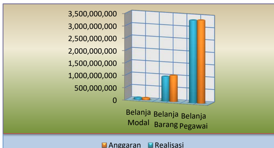
Grafik Komposisi Anggaran dan Realisasi Belanja Untuk periode yang berakhir 31 Desember 2021

/054.01.GG dan 2 output pada program Dukungan Manajemen /054.01.WA (Calk pendahuluan). Sedangkan untuk komposisi anggaran dan realisasi belanja dapat dilihat pada grafik di bawah ini: