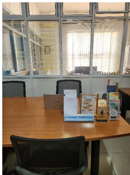
Gambar 3 Inovasi dalam pelayanan pengaduan masyarakat dan konsultasi statistik