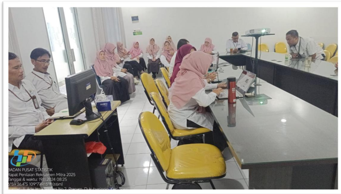
BADAN PUSAT STATISTIK Rapat Penilaian Rekrutmen Mitra 2025 Tanggal & waktu: 19/11/2024 08:25 5°59'36.4"S 109°7'49.13"E (±6m) Alamat: Jl. Arde Ima Satriani No.2, Program Dukuhpuri, Klaten, Slewu