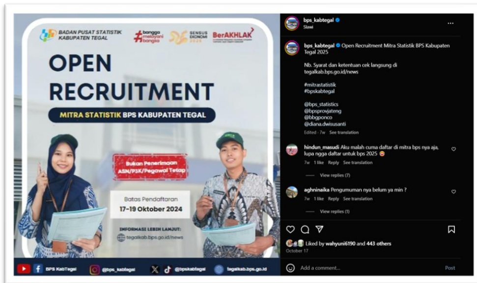
Pengumuman Pendaftaran Calon Mitra Statistik Melalui Media Sosial BPS Kabupaten Tegal