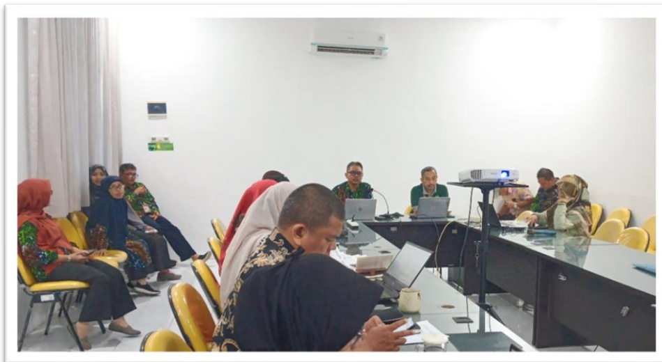
Rapat Panitia dan Internalisasi Rekrutmen Calon Mitra Statistik