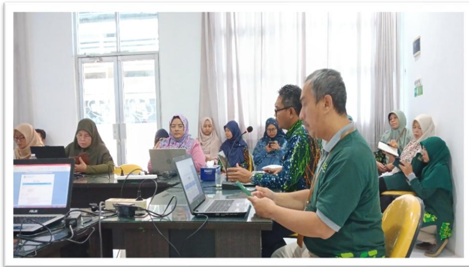
Rapat Persiapan Rekrutmen Calon Mitra