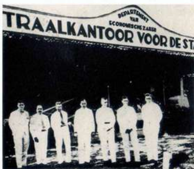
Gedung Centraal Kantoor voor de Statistiek