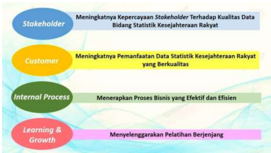
Gambar 4. Peta Strategi Direktorat Statistik Kesejahteraan Rakyat 2020-2024

Penjabaran Misi Direktorat Statistik Kesejahteraan Rakyat juga berpedoman pada penjabaran Misi Badan Pusat Statistik yaitu 4 (empat) misi dengan menggunakan pendekatan metode Balanced Scorecard (BSC) yang dibagi ke dalam 4 (empat) perspektif yaitu perspektif stakeholders , perspektif customers , perspektif internal process , dan perspektif learning and growth . Pendekatan ini digunakan agar implementasi dalam pencapaian sasaran strategis dari sistem penganggaran yang dikombinasikan dengan pendekatan penganggaran berbasis kinerja dan logic model framework dalam penataan arsitektur kinerja program dan kegiatan menjadi lebih mudah.