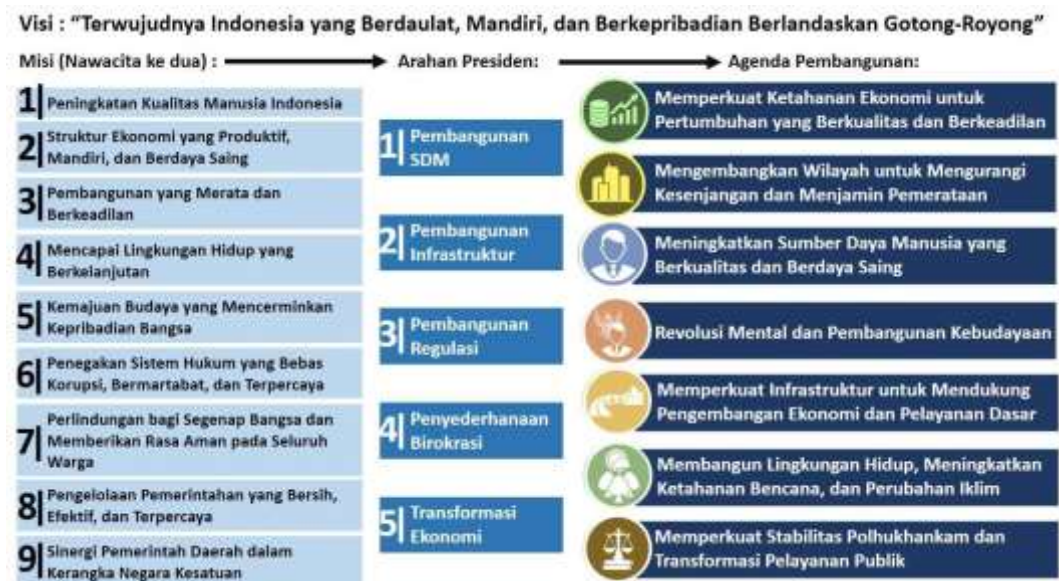
Gambar 3. Keterkaitan Visi, Misi Presiden 2020-2024 dengan Arahannya Presiden, dan Agenda Pembangunan dalam RPJMN 2020-2024

Sumber: Renstra Badan Pusat Statistik 2020-2024