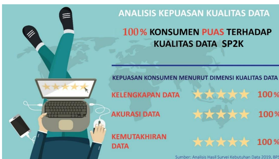
Gambar 1. Tingkat Kepuasan Konsumen terhadap Data Statistik Peternakan, Perikanan, dan Kehutanan (Hanya PST BPS Pusat)

Dari segi kualitas data, hasil SKD 2019 menunjukkan bahwa 100 persen konsumen merasa puas dengan data statistik peternakan, perikanan, dan kehutanan yang disediakan oleh BPS Pusat baik dari sisi kelengkapan, akurasi, maupun kemutakhiran (Gambar 1). Meskipun demikian, masih sedikitnya data statistik peternakan, perikanan, dan kehutanan yang di akses oleh pengguna data perlu mendapat perhatian. Di sisi lain, persentase konsumen yang puas terhadap akses data BPS adalah sebesar 94,87 persen yaitu kemudahan dalam hal memperoleh publikasi, metadata dan data dari website BPS.