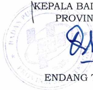
ENDANG TRI WAHYUNINGSIH

KEPALA BADAN PUSAT STATISTIK PROVINSI JAWA TENGAH