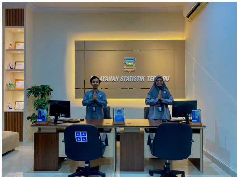
Selain satpam, petugas pelayanan juga sigap menjadi petugas pemandu untuk kelompok rentan