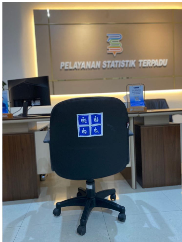
Loker pelayanan khusus untuk prioritas