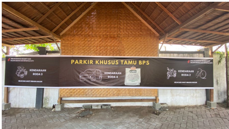
Tempat parkir berdasarkan jenis kendaraan yang dibatasi dengan saka