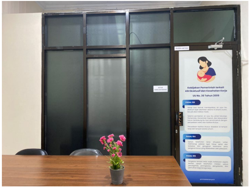
Terdapat Ruang Laktasi yang menjaga privasi