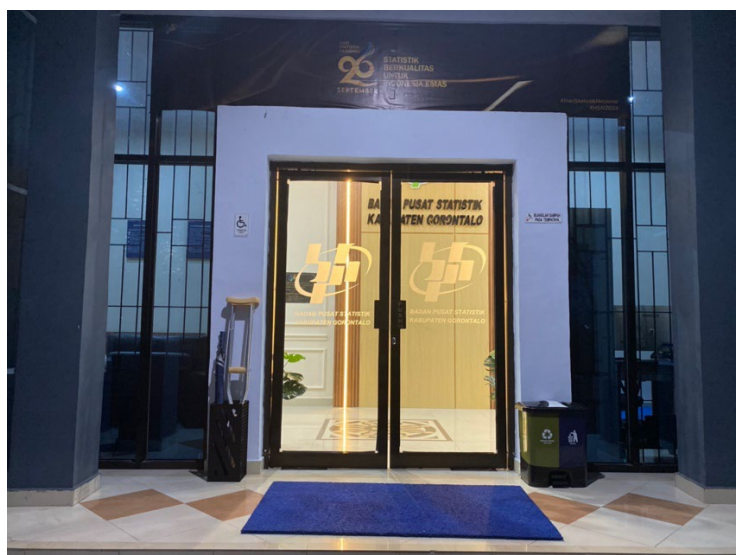
Kruk di sediakan di pintu masuk