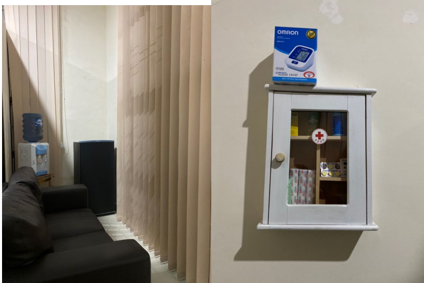
Ruang Laktasi yang dilengkapi kulkas untuk menyimpan ASI, Dispenser Air, Kursi dan Kotak P3K