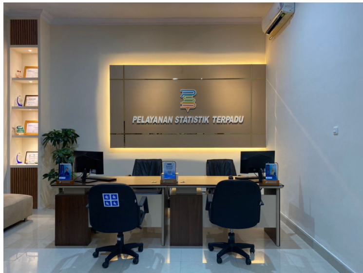
Menyediakan loket pelayanan khusus