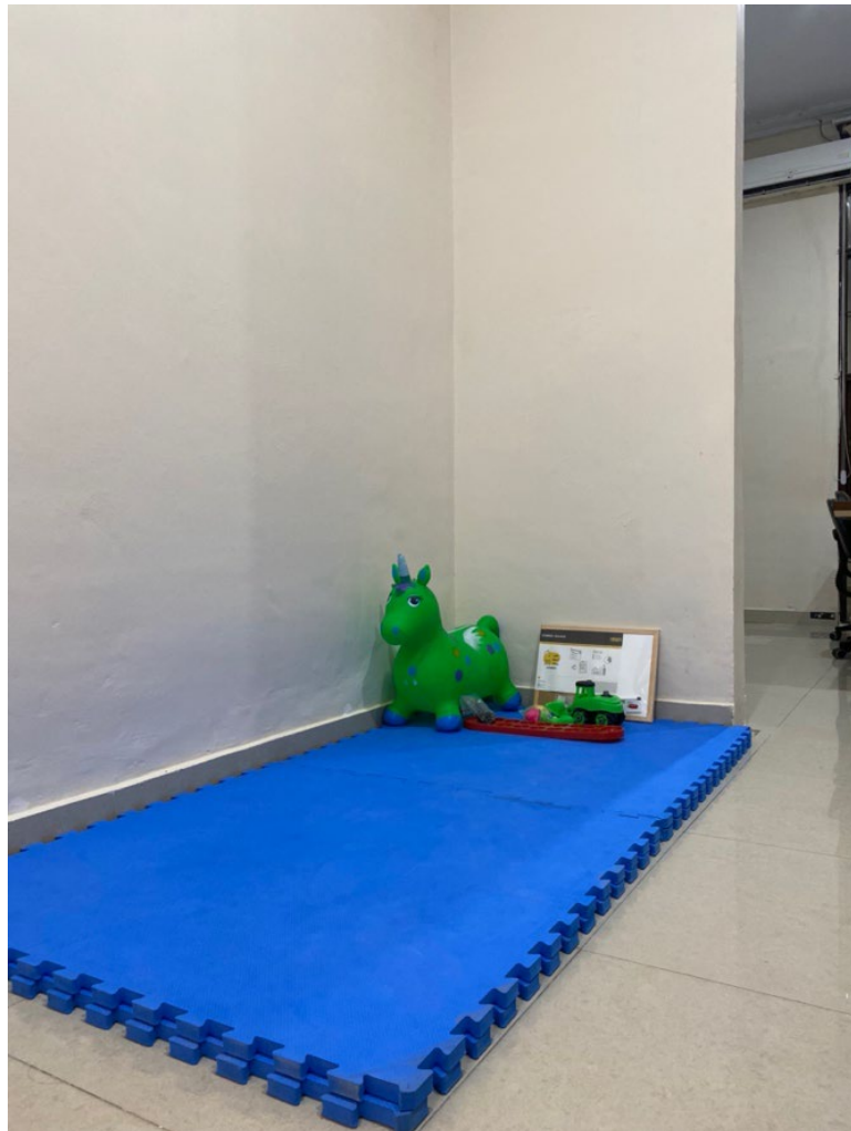
Area bermain dengan mainan