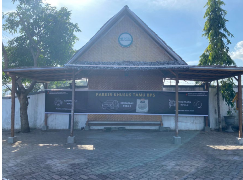
Tempat parkir khusus tamu BPS yang memiliki kanopi dan dipantau satpam melalui CCTV dalam gedung