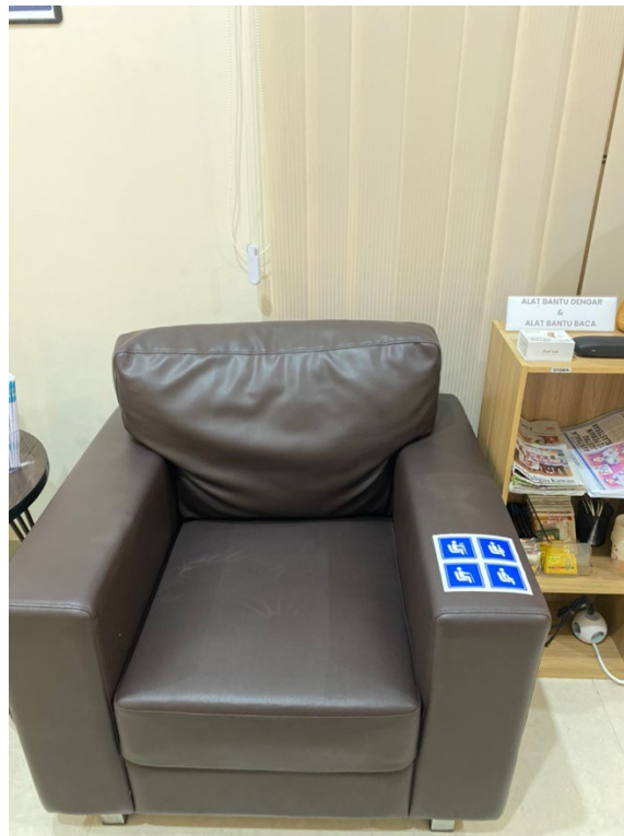
Kursi prioritas pada ruang tunggu yang diletakkan dekat dengan fasilitas untuk tamu dan loket pelayanan