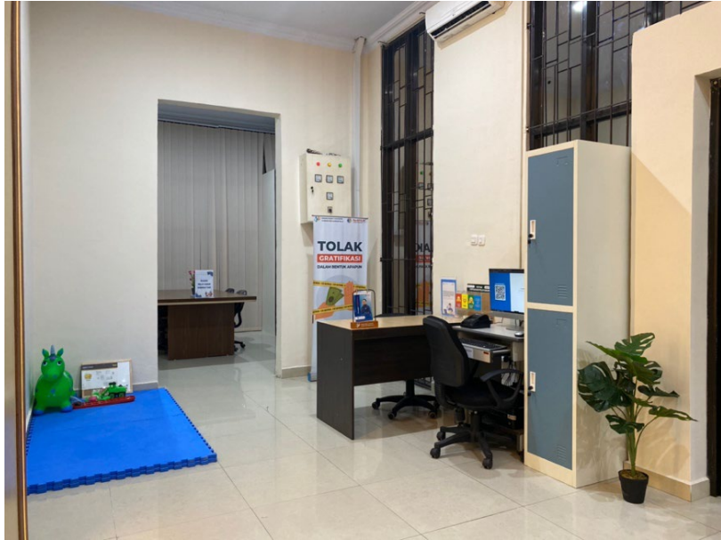
Area bermain anak yang diletakkan di tempat yang tidak berbahaya dan dekat dengan petugas front office yang berjaga