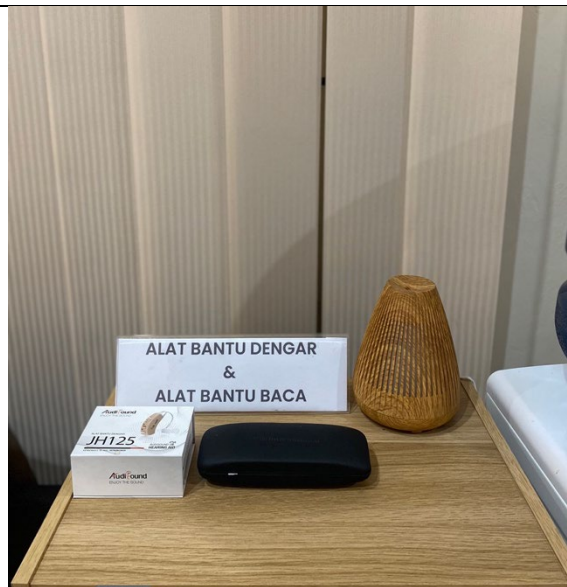
Tersedia alat bantu dengar dan alat bantu baca