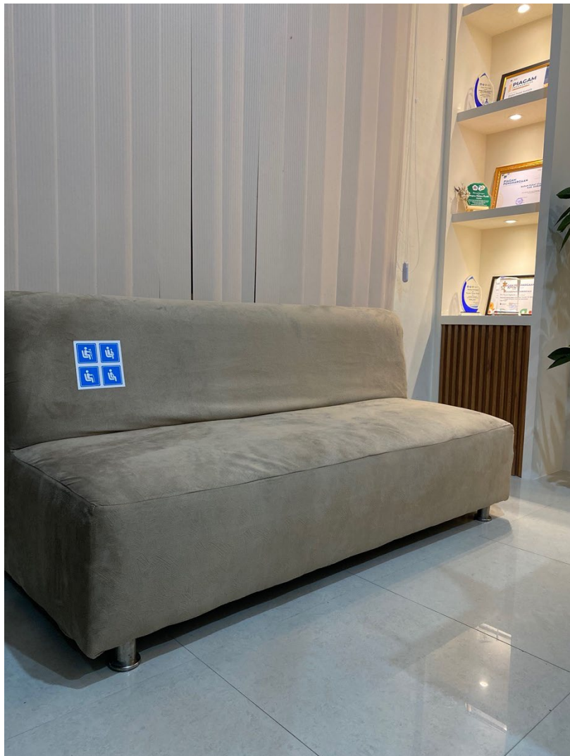
Spot khusus yang dekat dengan akses rak buku dan jalur keluar masuk