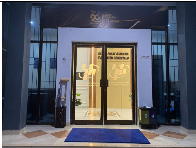
Pintu masuk yang mudah diakses